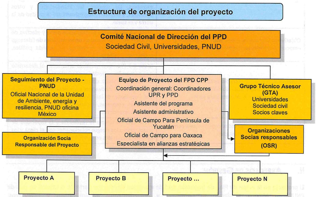
Figura 2. Organigrama del equipo (Elaboración propia, 2020)

La estructura de toma de decisiones y gobernanza es la siguiente: